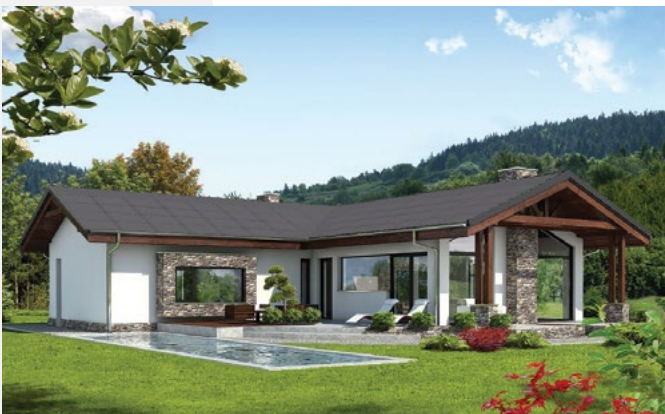
Antrazitfarbe SCL-240MA-TC64 AN

3D-Auslegungssoftware online verfügbar: PV Designer 3D - www.suncell.ch