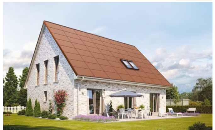
Terracotta Farbe SCL-190M64 TC